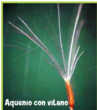
Aquenio con vilano

Nombre científico: Conyza bonariensis (L.) Cronquist