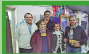
PROGRAMA DE EDUCACION ESCOLAR SOBRE EL APROPIADO USO DEL MEDICAMENTO