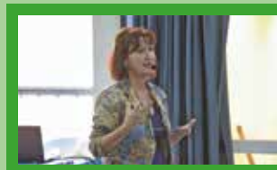
REUNIÓN CON LA MINISTRA DE SALUD DE LA PROVINCIA