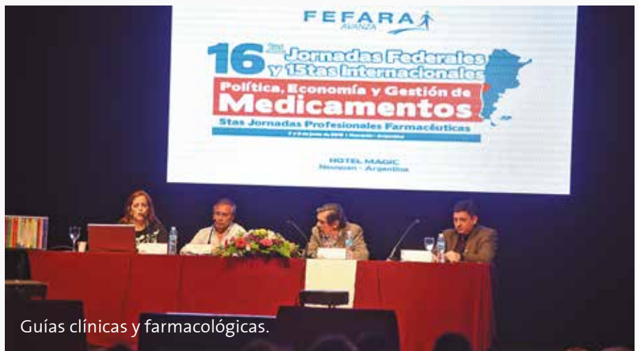
Guías clínicas y farmacológicas.