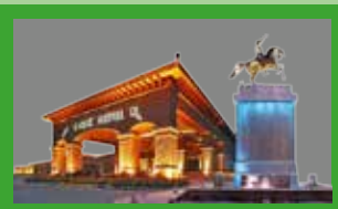
JORNADAS DE NEUQUEN