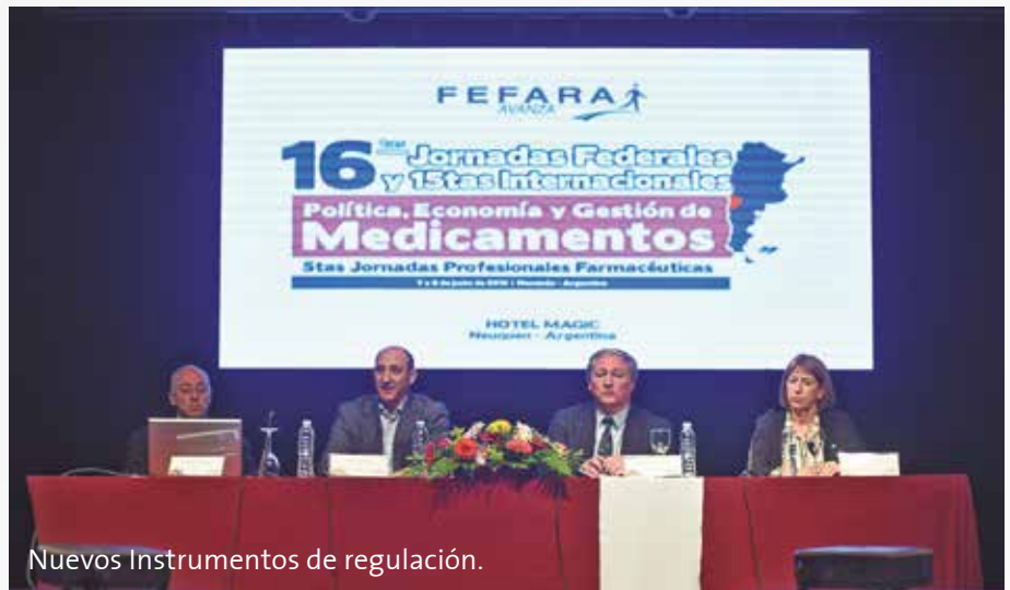
Nuevos Instrumentos de regulación.