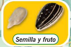
Semilla y fruto

Es conocido también como mirasol, maravilla.