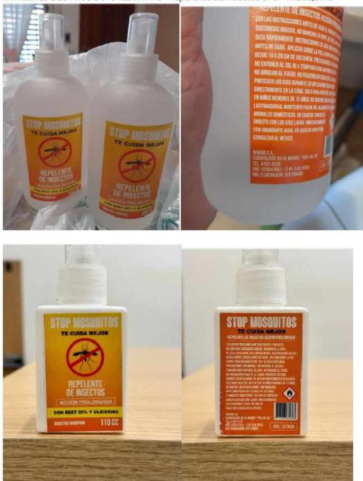
IMÁGENES DEL PRODUCTO ILEGÍTIMO –repelente de insectos STOP MOSQUITO

BOLETÍN OFICIAL 35.462. Miércoles 17 de julio de 2024.